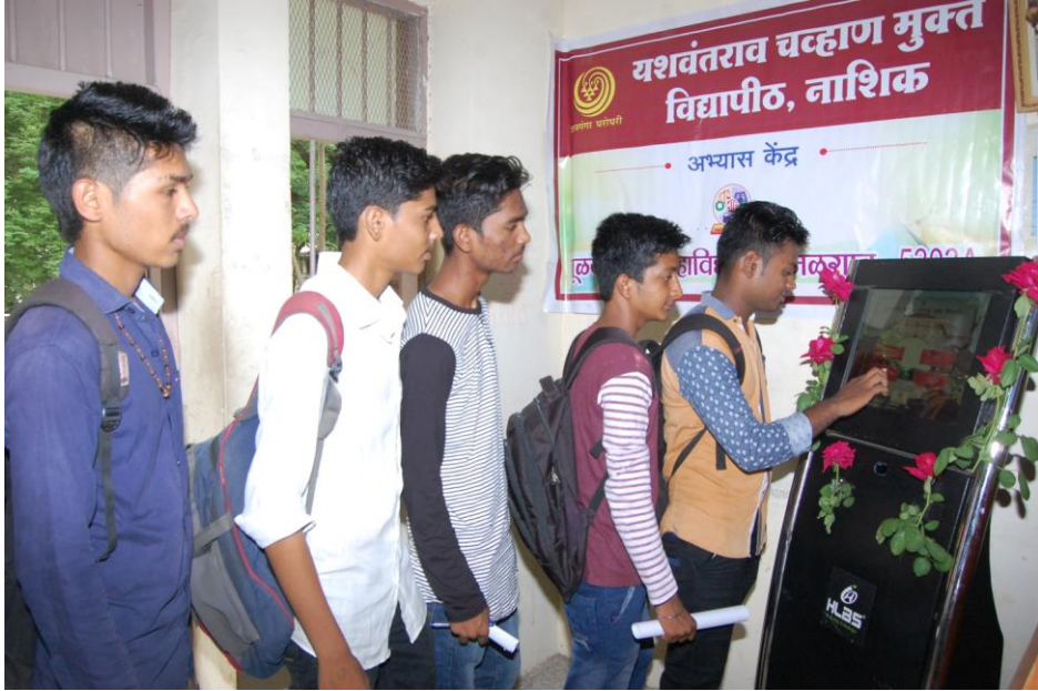
किऑक्स मशीनवर य.च.म.मु.विद्यापिठाच्या अभ्यासक्रमांची माहिती घेतांना विद्यार्थी